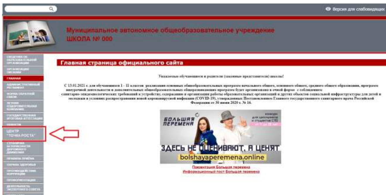
Рисунок 2. Пример размещения ссылки на раздел на сайте общеобразовательной организации

На официальном сайте общеобразовательной организации, в которой создается центр образования естественно-научной и технологической направленностей «Точка роста» (далее – центр «Точка роста», центр) в рамках федерального проекта «Современная школа» национального проекта «Образование», не позднее даты начала функционирования центра (не позднее 1 сентября года создания центра) создается раздел «Центр «Точка роста». Ссылка на раздел размещается в главном меню сайта общеобразовательной организации и должна быть видима при просмотре каждой страницы. Ссылка не может являться вложенной в другие меню. Пример размещения ссылки на раздел «Центр «Точка роста» в меню официального сайта общеобразовательной организации в информационно-телекоммуникационной сети «Интернет» приведен на рисунке 2.